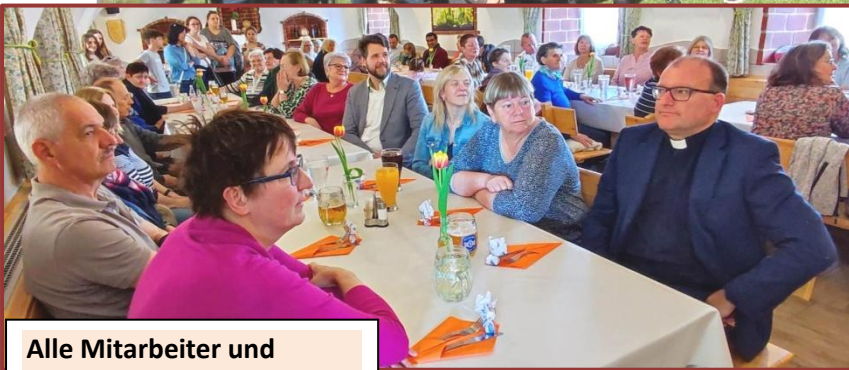
Alle Mitarbeiter und Mitarbeiterinnen der Pfarre waren zu einem Dankefest eingeladen. Gemütliches und fröhliches Beisammensein bei Speis und Trank beim Heurigen Macher.