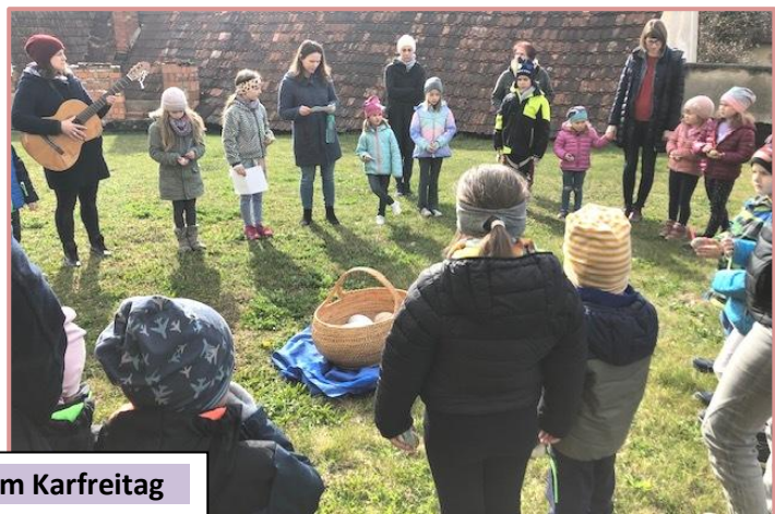
Kinderkreuzweg am Karfreitag