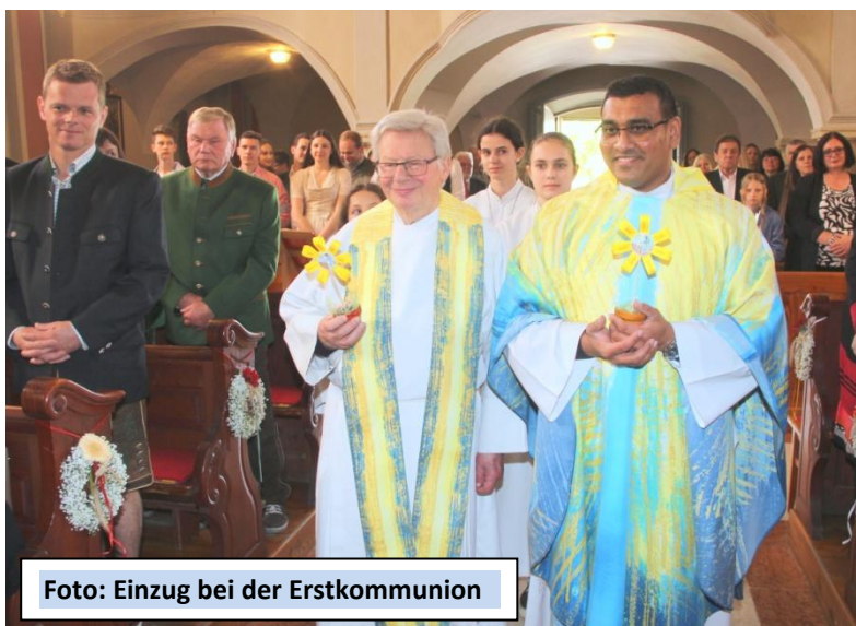
Foto: Einzug bei der Erstkommunion

Ich danke allen Mitarbeiterinnen und Mitarbeitern und allen, die mit mir ein Stück meines Lebens gegangen sind und mich in verschiedener Art und Weise bereichert haben, ganz besonders die Pfarre Preding und Pfarre Hengsberg. Sie werden immer ein Stück meines Lebens bleiben und immer einen Platz