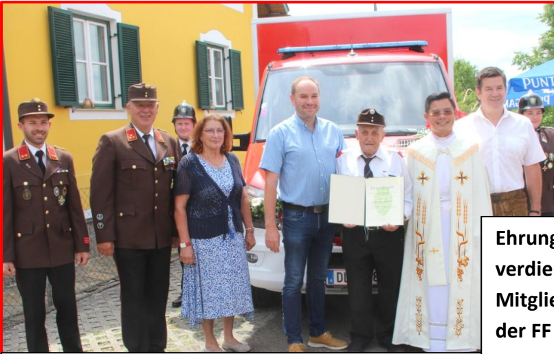
Ehrung verdienter Mitglieder der FF