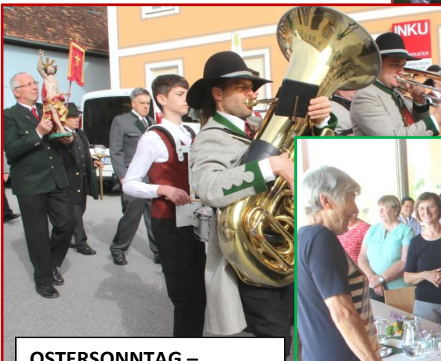
OSTERSONNTAG – Auferstehungsprozess