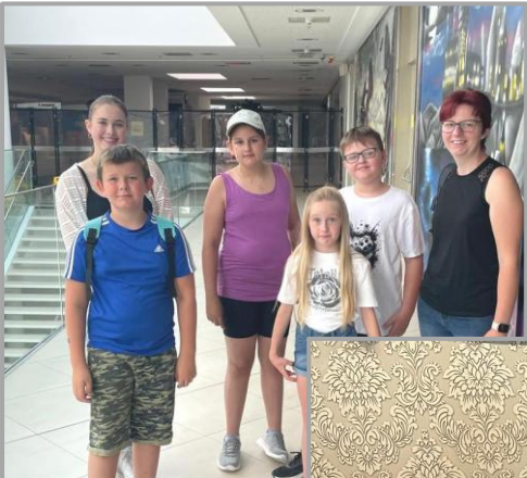
Die Verantwortlichen der Pfarre Preding bedanken sich für JEDE Mitarbeit in der Pfarre, besonders bei ALLEN Ehrenamtlichen!