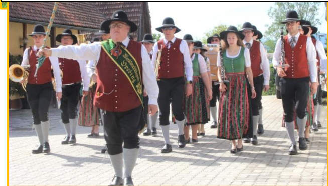
Ein großes Dankeschön an die Markt- Musikkapelle Preding, sie spielt bei vielen kirchlichen Anlässen.