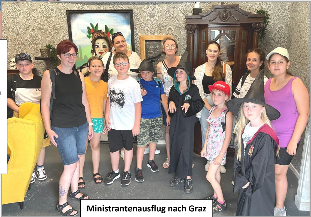
Ministrantenausflug nach Graz