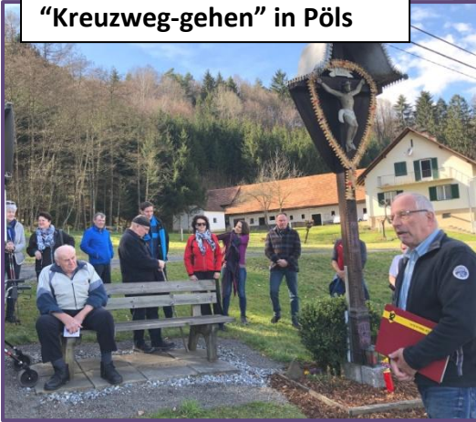
“Kreuzweg-gehen” in Pöls