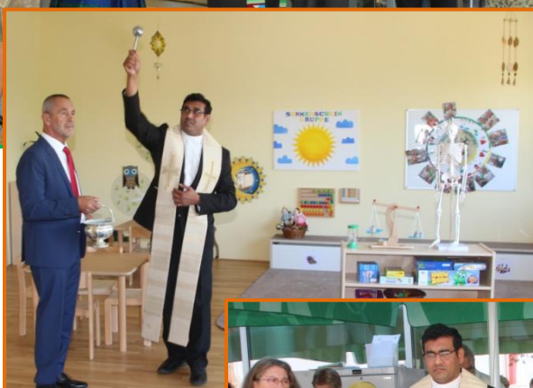
Eröffnungsfeier mit Segnung des neuen Gemeinde- zentrum mit Kindergarten