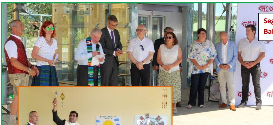
Segnung des neugestalteten Bahnhofes Preding-Wieselsdorf