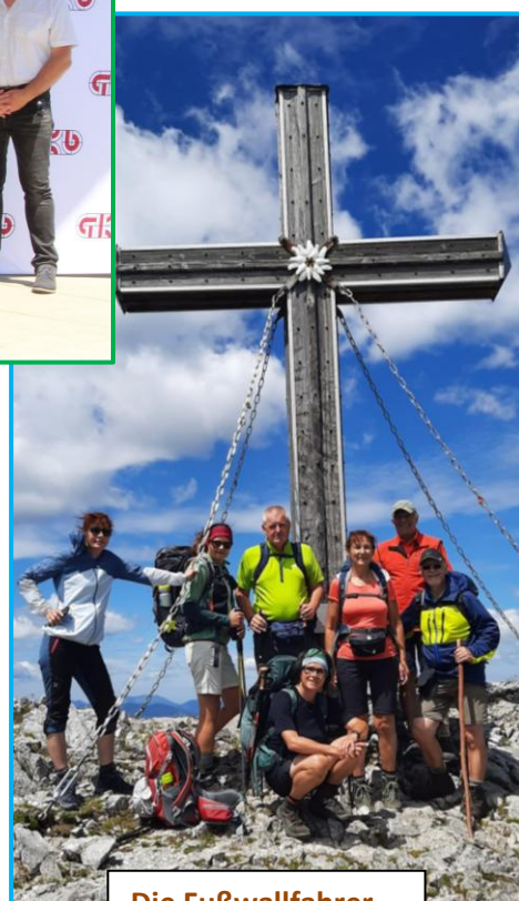
Die Fußwallfahrer unterwegs nach Mariazell