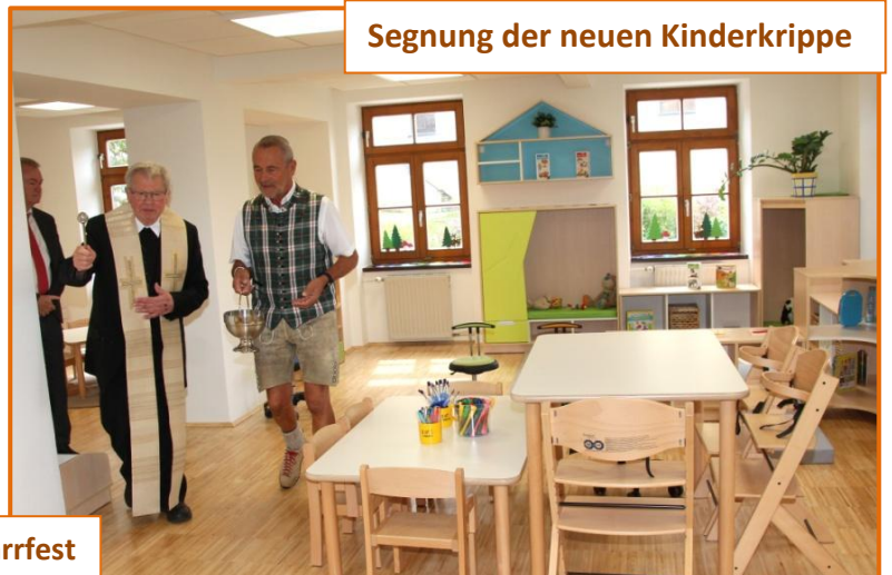
Segnung der neuen Kinderkrippe