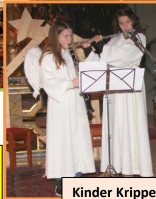
Kinder Krippenfeier am Hl. Abend