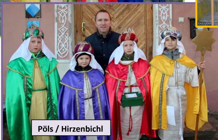
Pöls / Hirzenbichl