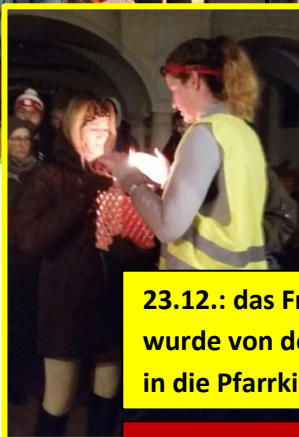
23.12.: das Friedenslicht wurde von den LäuferInnen in die Pfarrkirche gebracht