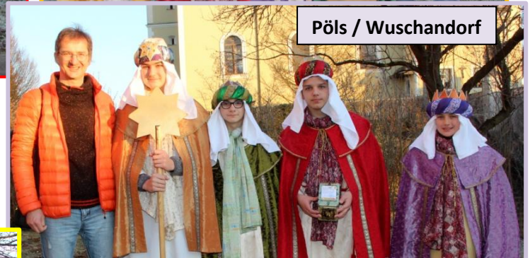
Pöls / Wuschendorf