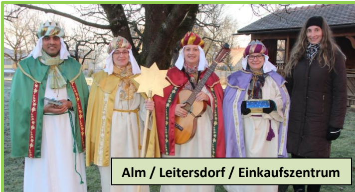
Alm / Leitersdorf / Einkaufszentrum