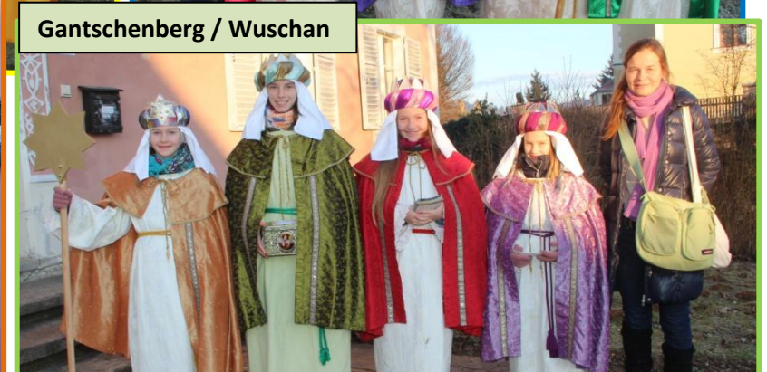
Gantschenberg / Wuschan

Ein herzliches Vergelt's Gott allen, die zum Gelingen der Sternsingeraktion beigetragen haben! Die Sternsinger konnten in Preding eine Summe von Euro 9.255,00 ersingen.